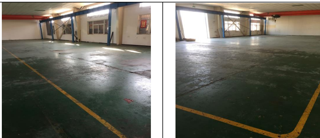
图 2 本项目厂房内部照片

本项目选址于天津市西青区大寺产业园区鸿泽路 20 号，租用天津市立道纸业有限公司现有空厂房作为生产经营场所，不涉及与本项目有关的原有污染及环境问题。