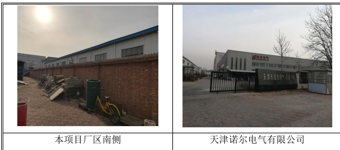
图 1 本项目选址处四侧照片